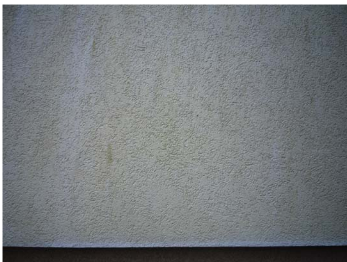
Vor der Behandlung