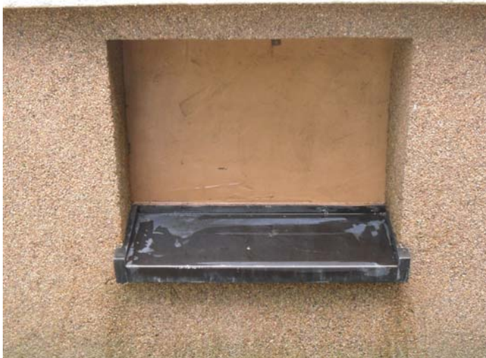
Nach der Behandlung