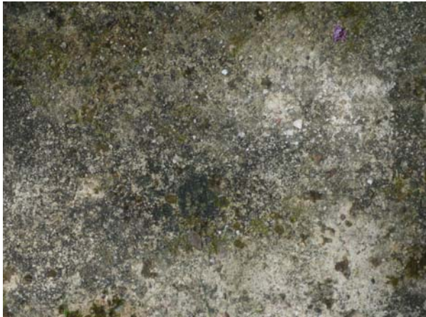
Vor der Behandlung

1 Tag später Abbürsten mit der Drahtbürste und Abspülen mit Wasser