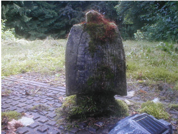
Rückansicht Vor der Behandlung

Behandlung: 2-maliger Anstrich, mit Wasser abgespült und leicht mit einem Handfeger abgekehrt