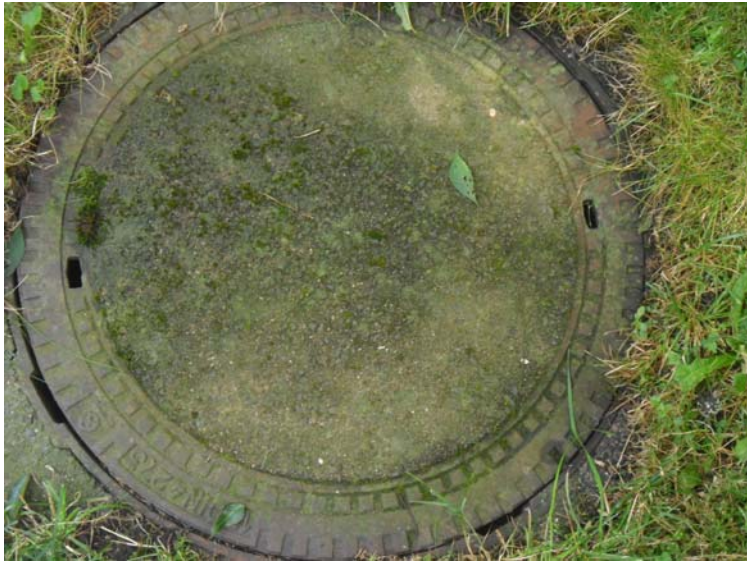
Vor der Behandlung

1 Tag später mit Drahtbürste gereinigt und mit Wasser abgespült