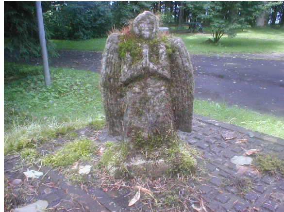
Vorderansicht Vor der Behandlung