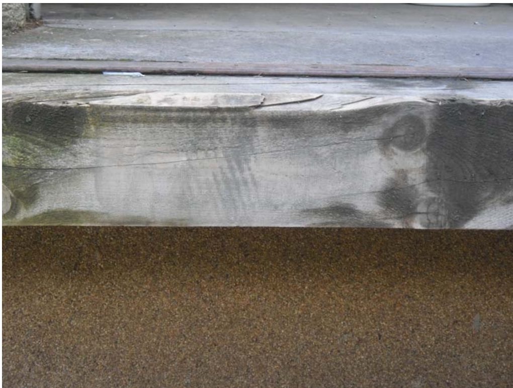
Nach der Behandlung