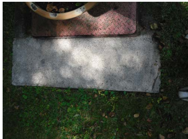
Nach der Behandlung