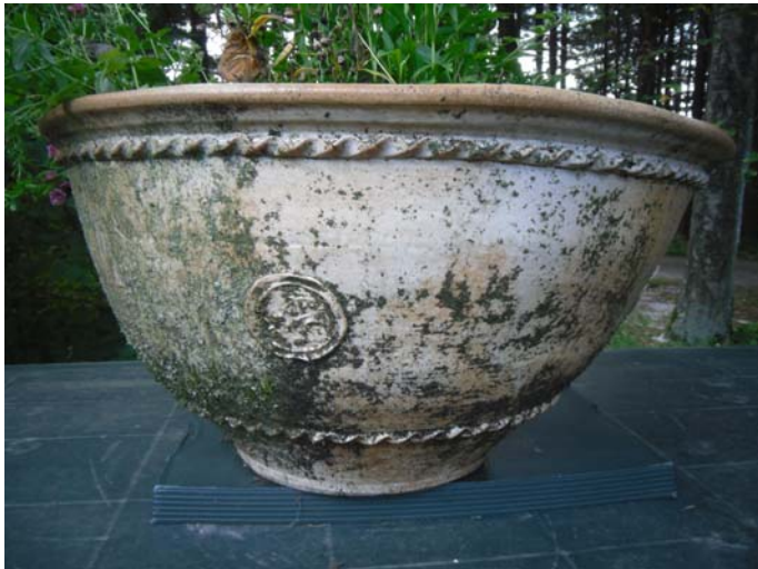
Nach 1. Anstrich mit Moosfrei