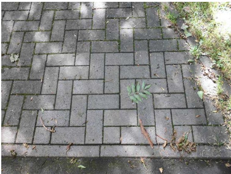
1 Jahr nach der Behandlung