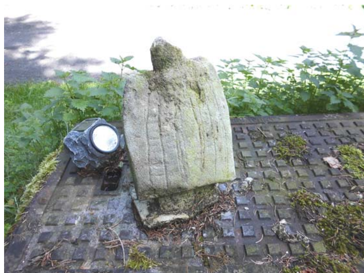
Rückansicht 1 Jahr nach der Behandlung