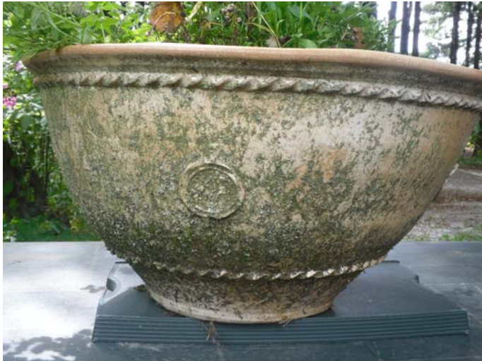
Vor der Behandlung

Behandlung: 1-maliger Anstrich, mit Wasser abgespült und leicht mit einem Haushaltsschwamm abgewaschen