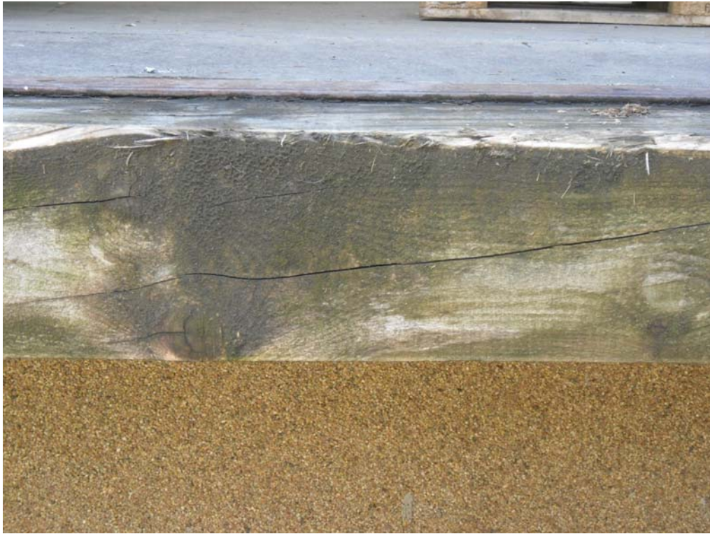
Vor der Behandlung

Behandlung: Einmaliger Anstrich 1 Tag später Abspülung des Schmutzes mit Wasser