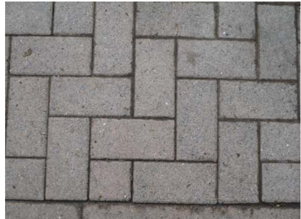
Nach dem 1. Anstrich