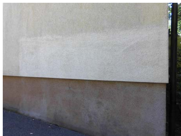
1 Jahr nach der Behandlung