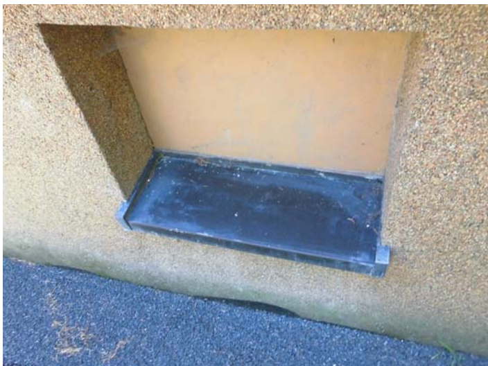
1 Jahr nach der Behandlung