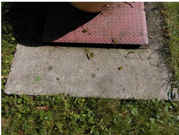
1 Jahr nach der Behandlung