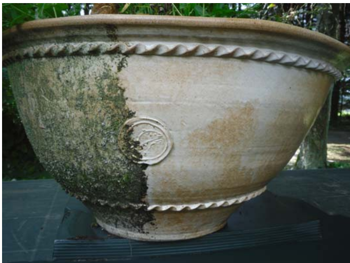
Nach Abwaschen mit Wasser und Haushaltsschwamm