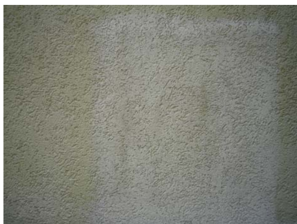
Nach der Behandlung