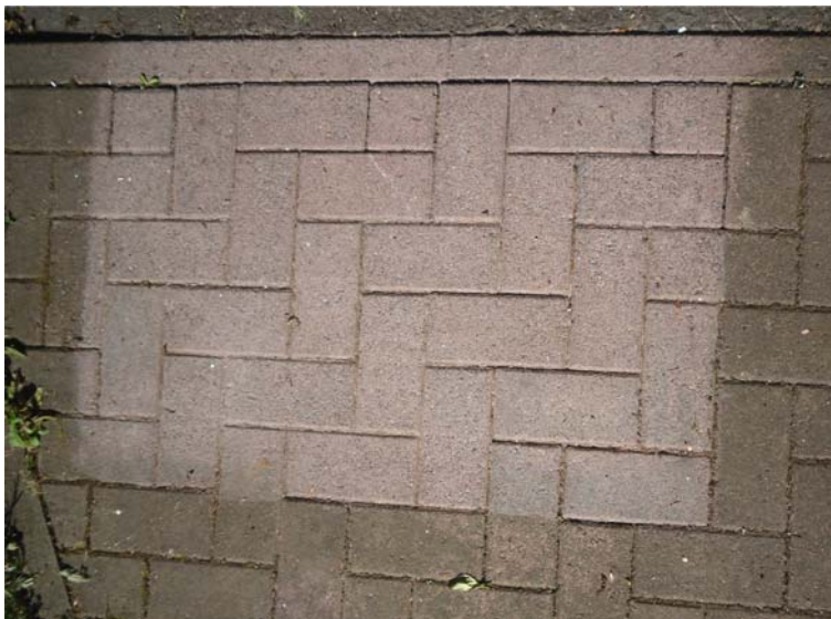
Nach Abbürsten mit Drahtbürste und Abspülen mit Wasser, nach Trocknung