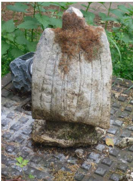
Rückansicht 2 Monate nach der Behandlung