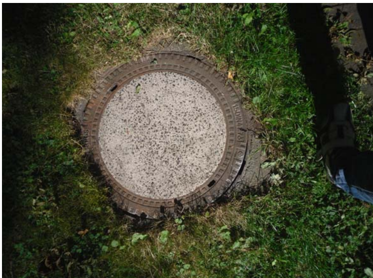
Nach der Behandlung