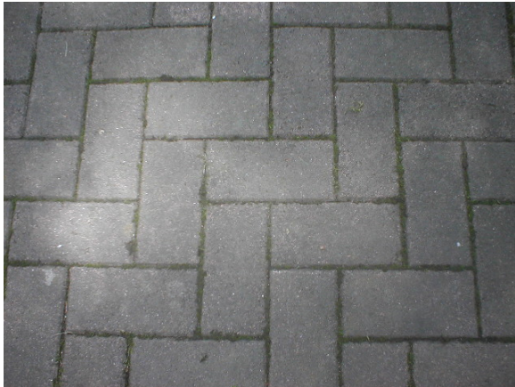
Vor der Behandlung

1 Tag später mit Drahtbürste gereinigt und mit Wasser abgespült