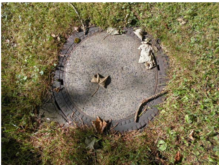
1 Jahr nach der Behandlung