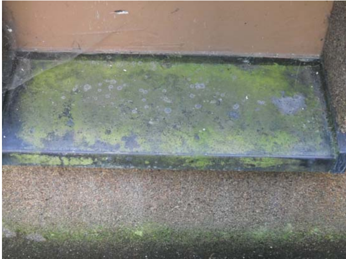
Vor der Behandlung

1 Tag später mit einem Haushaltschwamm mit Wasser gereingt