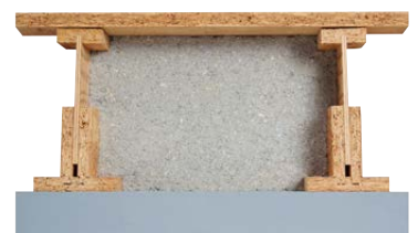
Bodenexpander BE mit Bodentasche BT